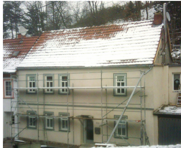
während der Sanierung