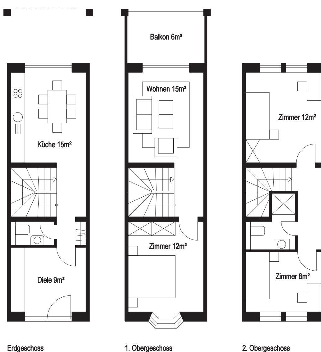
Typ 2 | Familie mit zwei Kindern - 90 m 2