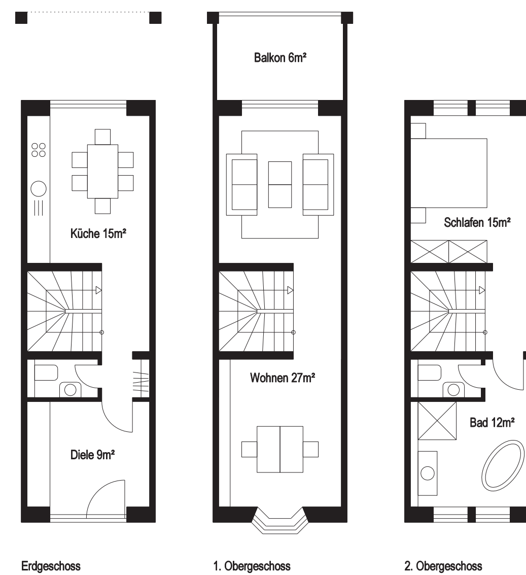
Typ 3 | Loft - 90 m 2