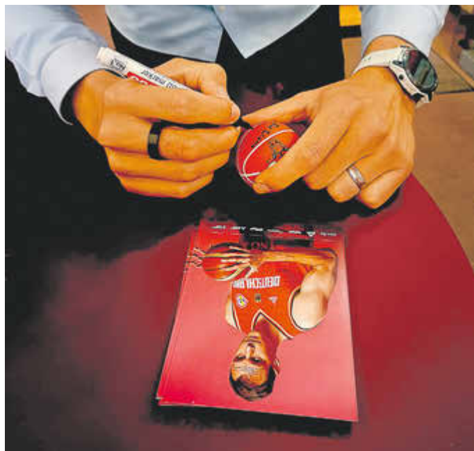
Sehr begehrt waren die Autogrammkarten mit persönlicher Widmung von Johannes Voigtmann, die er geduldig für Gäste und Fans unterschrieb.

Nach dem offiziellen Teil im Ratssaal des Eisenacher Rathauses ging es im Foyer des historischen Rathauses mit einer öffentlichen Autogrammstunde weiter. Johannes Voigtmann nahm sich für alle wartenden Gäste und Fans viel Zeit für ein kurzes Gespräch, ein gemeinsames Foto oder auch persönliche Widmungen. 500 Autogrammkarten lagen bereit, der Andrang nach Autogrammkarte und Schnappschuss mit dem Weltmeister waren groß.