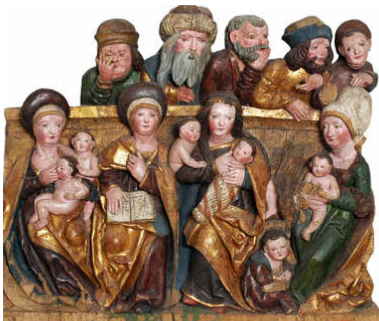
Abb.: Heilige Sippe, Leihgabe der Ev.-Luth. Kirchengemeinde Rabis