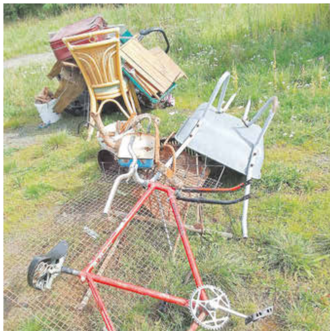
Einer der gesammelten Müllhaufen

Diese sind: Vertreter*innen der Stadtverwaltung Eisenach, unter anderem der Fachbereich Sicherheit und Gewerbe, der Fachbereich Bürgerservice, Bildung, Jugend, Stadtentwicklung und Kultur und das Fachgebiet Kommunale Umweltangelegenheiten, außerdem der Abfallwirtschaftszweckverband Wartburgkreis - Stadt Eisenach (AZV), die Bürgerinitiative Karlskuppe und die Bürgerinitiative Sauberes Mariental, sowie die Eisenacher Versorgungsbetriebe (evb), die Eisenach-Wartburgregion Touristik GmbH (EWT), die Polizei, der Umweltservice Wartburgregion GmbH (USW) und die Verkehrsgemeinschaft Wartburgregion (VGW).