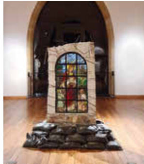
Fragments No. 6 © Anja Kaufmann

Fragments No. 6 Skulptur · Manaf Halbouni, Berlin, Zagreb