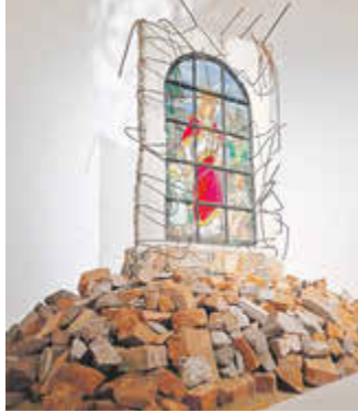
Elisabeth-Statue in der Predigerkirche