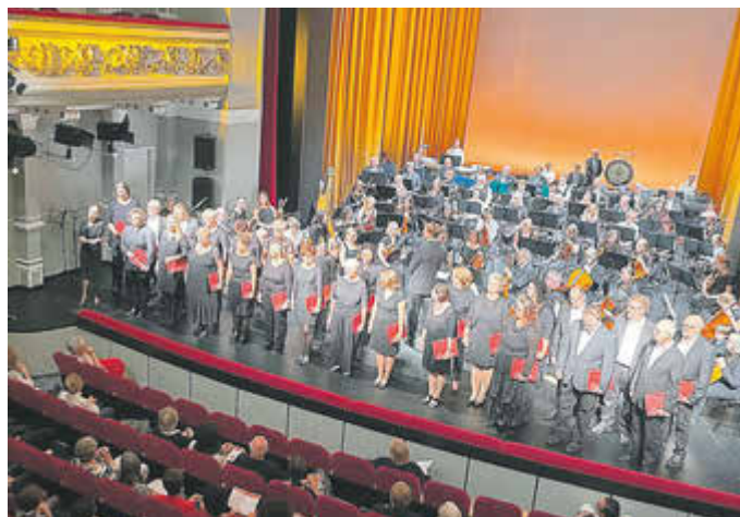
Eindrücke vom Jubiläumskonzert der Musikschule „Johann Sebastian Bach“ im Landestheater Eisenach

ausgewogenen Klang, lebhaften Tempi und viel Ausdrucksstärke zu verhelfen.