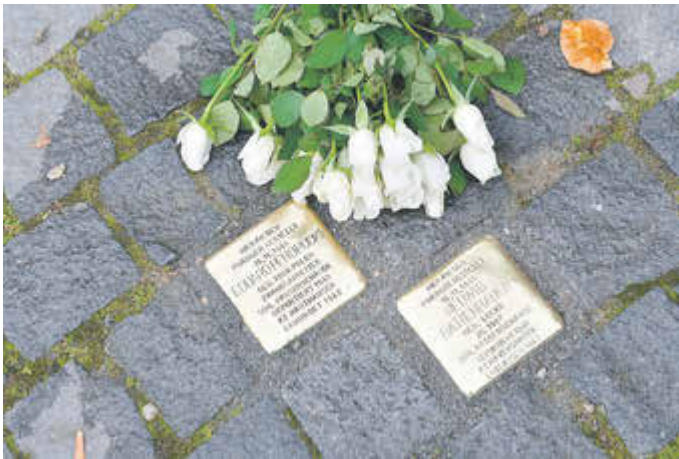
Die beiden neu verlegten Stolpersteine auf dem Eisenacher Marktplatz

Neue Stolpersteine sind in Eisenach verlegt worden. Am Dienstag, 3. Oktober, sind an fünf Orten Stolpersteine für acht Menschen in Gehwegpflaster eingesetzt worden. Die Steine erinnern an die Angehörigen der Familien Maerker, Müller, Meyer, Treu, Gorter, Hattenhauer und Pendrucki.